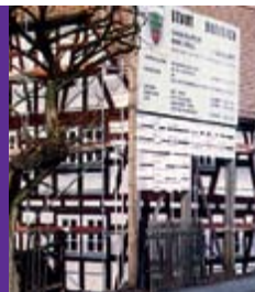
1994 Einweihung des zweiten Bau- abschnitts der Winkelmühle