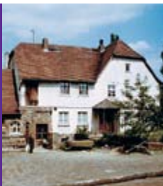
ab 1979 Umbauarbeiten

Die umseitig im Info-Kasten beschriebenen Gruppenangebote sind für Besucherinnen und Besucher kostenfrei.