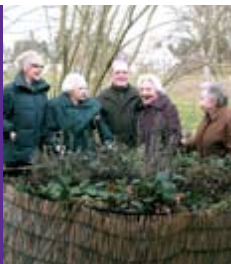
2007 Einweihung eines Hochbeetes im Garten der Winkelmühle

Gesundheit zu erhalten, die Teilnahme am Leben in der Gesellschaft zu ermöglichen und das Thema Demenz und die Situation pflegender Angehöriger öffentlich zu machen. Das im Januar 2002 in Kraft getretene Pflegeleistungsergänzungsgesetz (§45 SGB XI ff.) unterstützte dieses Ziel. Danach können heute zusätzliche Leistungen für Personen, die einen erheblichen Bedarf an Beaufsichtigung oder Betreuung haben und mindestens in Pflegestufe I eingestuft sind, bei der Pflegekasse abgerufen werden. Der nächste Schritt war dann, eine Betreuungsgruppe für Menschen mit Demenz zur Entlastung pflegender Angehöriger aufzubauen. Ein Konzept wurde in einem Arbeitskreis erarbeitet, der sich aus VertreterInnen der Seniorenberatung der Stadt Dreieich, der Leiterin des Gesprächskreises pflegender Angehöriger, der Diakoniestation Pflegedienste in Dreieich, einer Stadtverordneten und dem regionalen Diakonischen Werk zusammensetzte. Das Konzept wurde der Leitstelle Älterwerden des Kreises Offenbach zur Anerkennung vorgelegt und die Winkelmühle