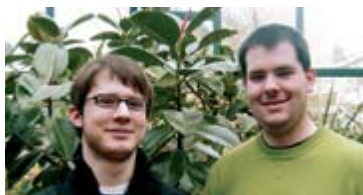
Die beiden Zivildienstleistenden der Begegnungsstätte

Es ist schon erstaunlich, wie gut die jungen Männer ihre Aufgaben meistern – werden sie doch oft direkt nach der Schulausbildung in den Zivildienst befohlen. Einige haben noch keine Berufserfahrung und können nicht wissen, wie die Strukturen in Betrieben sind. Sie finden sich jedoch rasch ein und meistern die vielfältigen neuen Situationen.