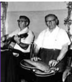
1968 Darmstädter Straße

Angefangen hat alles im November 1968 mit einem Weihnachtsbasar. Von der Kleidersammelstelle in Gravenbruch wurden Kleider geholt und von fleißigen Händen aufgearbeitet, gereinigt und an Bedürftige verteilt. Aus nicht mehr zu flickenden Sachen entstanden unter anderem Puppenkleider, die beim von nun an jährlich stattfindenden Basar verkauft wurden. Von den Erlösen der Altkleiderbasare wurde ein Teil der Ausstattung der Altentagesstätte finanziert.