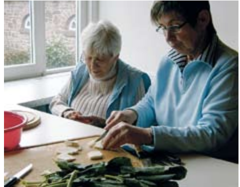
Gemeinsames Kochen bei der Übermittagbetreuung

Dieses Konzept der Betreuungsgruppen als niedrigschwelliges Betreuungsangebot ist nicht nur ein sinnvolles Tätigkeitsfeld für freiwillig engagierte BürgerInnen und fördert den Leitgedanken des „neuen“ und verstärkten Bürgerengagements, sondern es hat sich im Laufe