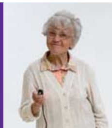
2007 Fotoausstellung „Momentaufnahmen aus der Welt des Vergessens“