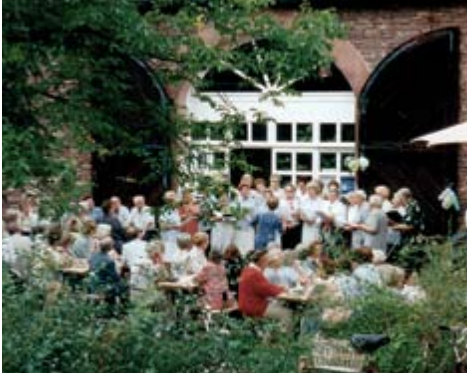
Buntes Treiben beim Sommerfest 1997