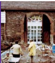
ab 1979 Umbauarbeiten

Bis heute hat sich die historische Mühle zu einer modernen Begegnungsstätte entwickelt, in der sich junge und alte Menschen gerne zu unterschiedlichen Aktivitäten einfinden. Im Schnitt kommen monatlich 800 Besucher, ein „Stammkreis“ von 160 Seniorinnen und Senioren findet sich mehrmals in der Woche ein. Die Winkelmühle steht allen Altersgruppen offen, denn hier sollen sich die Generationen begegnen. Informationen zu dem abwechslungsreichen Veranstaltungsprogramm der Begegnungsstätte finden Sie ab Seite 11.