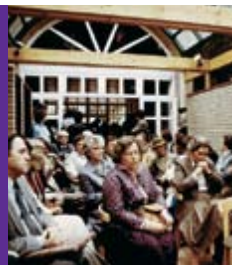
1983 Einweihung des ersten Bauabschnitts der Winkelmühle und Einzug der Begegnungsstätte